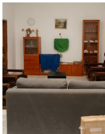
Le séjour Maison à Nguekokh