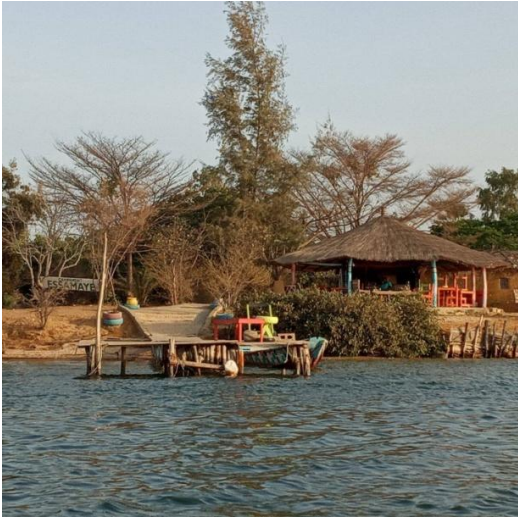
Campement Essamaye au Sine Saloum